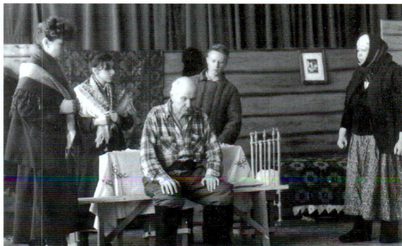
Бяльніцкі народны тэатр юнага глядача.