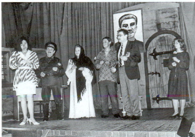
Прэм'ера спектакля «Канвеер» па п'есе Міхася Карпечанкі ў пастаноўцы Валянціна Ермаловіча ў Бялынічах