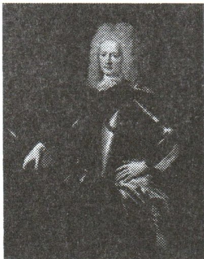
Якуб Генрых Флемінг

Алхімік ужо крыху аддыхаўся і мог гаварыць спакойней.