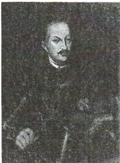
Ян Казімір Сапега

Але вялікіх прыкрасяў канфедэраты не мелі. Хто як мог хутчэй, пакідалі змагары сваю палітычную арэну. Добра і тое, што гледачы не вызначалі пальцам лёс гладыятараў. Тыя, хто меў сапежанскае суседства, прыкідвалі, чаго ім будзе каштаваць удзел у гэтай забаве па вяртанні дадому. Шляхта адчувала палёжку, скінуўшы цяжар абавязку і нягоды абложнага жыцця, але яшчэ больш умацавала-