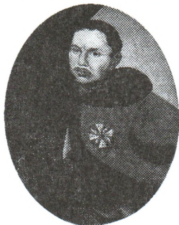
Людвік Канстанцін Пацей

Сапегі адказалі руйнаваннем вёсак і маёнткаў багацейшых канфедэратаў, адначасна сцягваючы пад Гародню надзейныя войскі. На ўсялякі выпадак вялікі гетман папрасіў дапамогі ў брандэнбургскага электара. Такі васьць ці то разбой з прыкметамі вайны, ці то вайна ў выглядзе разбою, з дапамогай чужынцаў у сваёй краіне на гора ўласнаму люду.