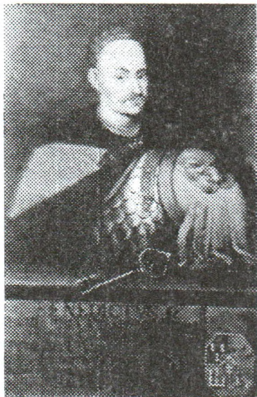
Бенедыкт Павел Сапега

– А я не жартую. Звяртацца будзе не хто-небудзь з нашай забіяцкай хеўры, а сама Яе Вялікасць каралева.