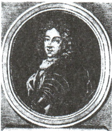
Франсуа Луі дэ Бурбон князь дэ Канці

Амбасадар цэсара Леапольда выступаў, прапануючы каралевіча Якуба Сабескага. Пасольства дона Одэскальчы, пляменніка Папы, моцна спазнілася і разлічвала на падтрымку каралеўскага згуртавання толькі ў выпадку адхілення Якуба. А каралева шматлікімі лістамі да ўплывовых асобаў, сустрэчамі і зваротамі старалася сабраць галасы для сына. Нібыта нават цар на яе старанне ў лісце дэпрымаса выказаўся супраць кандыдатуры князя Канці. Але зацятая барацьба нечакана скончылася абвяшчэннем Якуба, што ён выходзіць з канкурэнцыі. Пайшлі чуткі, нібыта цэсар заявіў, што будзе падтрымліваць князя нэйбурскага. Больш здагадлівыя пераконвалі, што тут мачала пальцы цэсарыха, каб мець на троне Рэчы Паспалітай не швагра Якуба, а свайго брата.