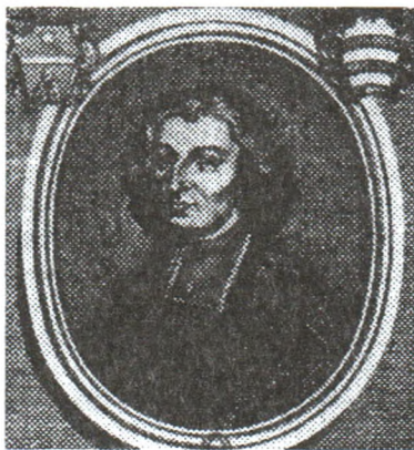
Мельхіёр дэ Паліньяк

Тое, што не адбылося на Канвакацыях, непазбежна павінна было ўзнікнуць зараз, на элекцыйным Сойме. Іншай нагоды да змагання не будзе. Найбольш зацятая барацьба закіпела між групоўкамі князя Канці і каралевіча Якуба. Спачатку пайшлі ўзаемныя абвінавачанні ў сканфедэраванні войска. А праз два тыдні пасол з Каліша вынес на разгляд нейкія паперы, як доказ датычнасці каралевы да вайсковай канфедэрацыі. Прыхільнікі Марыі-Казімеры даводзілі, што паперы сфальшаваны яе непрыяцелямі. У выніку выступы замежных паслоў пачаліся толькі праз колькі дзён.