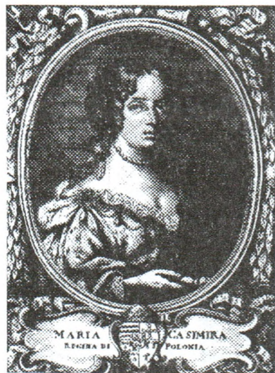
Каралева Марыя Казіміра

– Ці скінуў Сойм каго-небудзь з трона? Ці не ўпрошваў уцекача Генрыха Валуа вярнуцца? І ці так цяжка сарваць кожны Сойм? Кароль залежыць ад Сойму, але і Сойм ад яго не менш. Нездарма