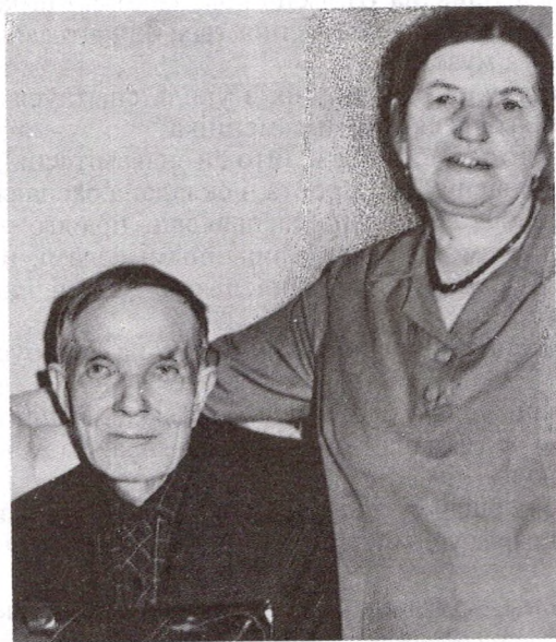
Да замалёвак «Мама» і «Тага»