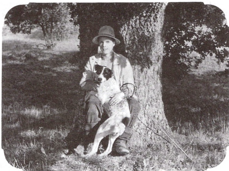
Да замалёўкі «Акопы» Купалаў дуб