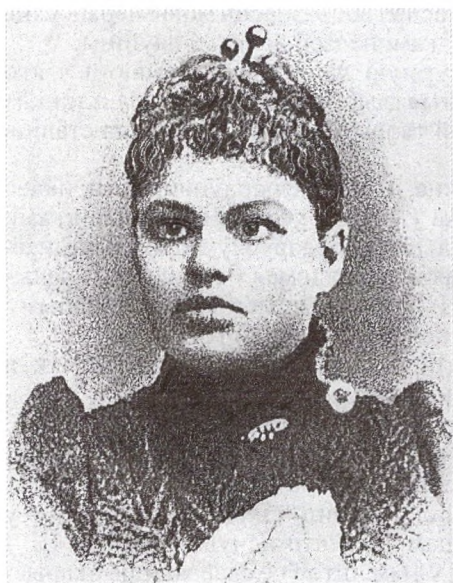
Да замалёўкі «Мой Ядвігін Ш.» Луцыя Гнатоўская