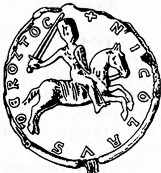
Пячатка Мікалая, князя Ростак. 1189 л.

Ва усабіцу ўмяшаліся князь Ругена Ярамар, які прыняў бок Мікалая і паморскі князь Багуслаў, што падтрымаў свайго пляменніка Генрыху Борвіна. Кароль Даніі Кнуд VI скарыстаўся сваркай братаў і ўзмацніў свой ўплыў у гэтым рэгіёне. У выніку Мекленбург і Ілава былі прызнаныя каралём за валоданнем Генрыху Борвіна, а Мікалай атрымаў ва ўпраўленне Ростак. У 1200 л. 25 траўня ў бітве каля Ратцэбурга Мікалай быў забіты і з прычыны таго, што дзяцей у яго не было, Ростак перайшоў пад кіраванне Генрыху Борвіна.