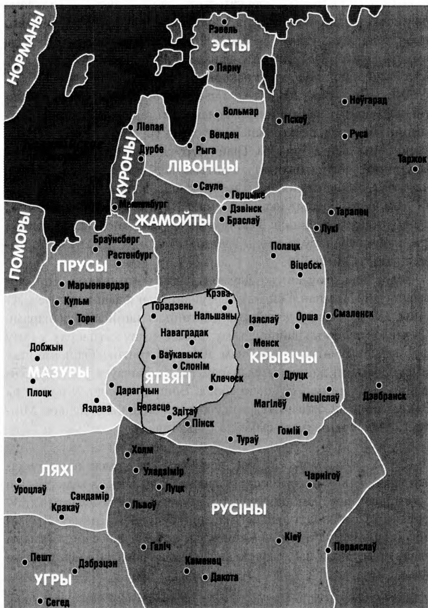
Мяжа ВКЛ і землі ў 6771 лета (1263 га па хрысціянскім календары)