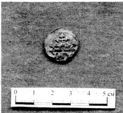
Рис. 1. Лицевая сторона печати.

Однако по городельской грамоте 1413 г. герб «Домброва» никто из