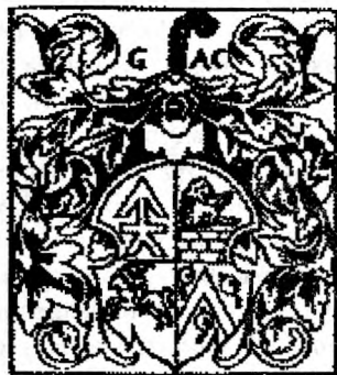
Герб Грыгорыя Хадкевіча, 1569 г. Гравюра з «Евангелля вучыцельнага» І. Фёдарова.

Пячатка: надрукавана без пазначэння характарыстык 104 .