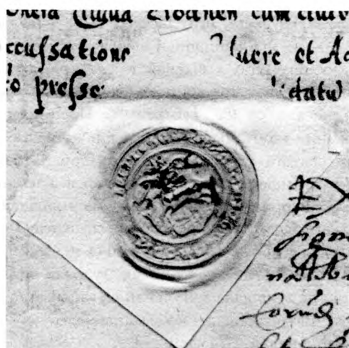
Ілюстрацыя 1. Лаўніцкая пячатка з 1565 г. (з дакумента 1575 г., ГДГАМ, б/н)