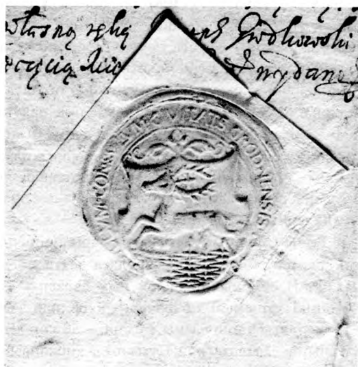
Ілюстрацыя 2. Радзецкая пячатка з 1540 г. (з дакумента 1641 г., Oddział rękopisów Biblioteki Uniwersitetu Warszawskiego, sygn. 260)