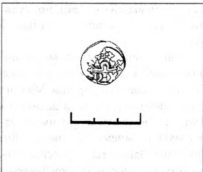
Рис. 3. Прорисовка оттиска печати.