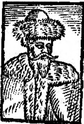
Уяўны партрэт гарадзенскага староцы Аляксандра Грыгоравіча Хадкевіча, з кнігі Барташа Папроцкага «Гняздо цноты» , Кракаў, 1578 г.

Alexander syn Georgow Kąsny. Wilnień. Staro. Grodzieński. 1578.