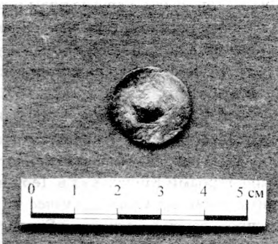
Рис. 2. Обратная сторона печати.