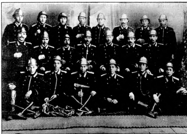
Гарадзенская пажарная каманда. 1907 г.

У матэрыялах фондаў Нацыянальнага гістарычнага архіву Беларусі ў Горадні захавалася апісанне выезду пажарнай каманды на пажар: «Пры ўзнікненні пажару неадкладна адпраўляецца пажарны абор [...] для чаго найперш перавозіцца адна пажарная труба, запражэная па-