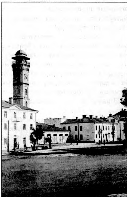
Пажарны завулак і дэпо на вул. Замкавай, 19. Пачатак XX ст.

Пасля пажару 1869 г. гарадскія ўлады ўсё ж выдаткавалі сродкі і купілі коней, бочкі, нанялі на службу людзей і арандавалі дом на Замкавай вуліцы, які належаў летняму ваеннаму лазарэту. У 1869 г. пажарная каманда ўжо складалася з брандмайстра, двух унтэр-брандмайстраў і 34 радавых 20 . У канцы гэтага года ў горадзе праводзіліся таргі з мэтай арганізацыі дастаўкі