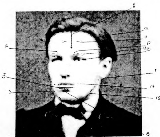
Ілюстр. 3. Фотаздымак асобы, «падобнай на Каліноўскага», з фонду Музея графа М. Мураўёва з паметкамі эксперта.

«Фотаздымак № 3, чорна-белы, прастакутнай формы. На здымку захаваны мужчына ў поўны рост. Мужчына – антрапалагічнага тыпу еўрапеоід, узрост на выгляд – каля 20 гадоў. Галава ў яго павернутая да аб'ектыву левым паўпрофілем. У мужчыны цёмныя валасы...».