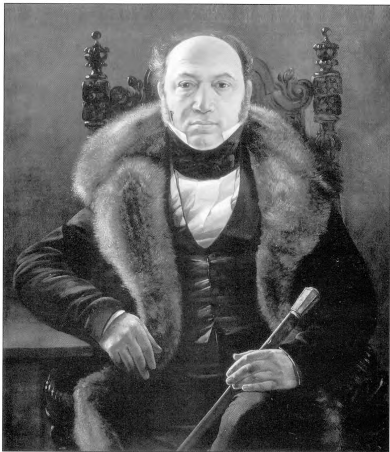
І. Хруцкі. Партрэт Мікалая Маліноўскага (са збораў Музея ў Вілянове, Польшча)