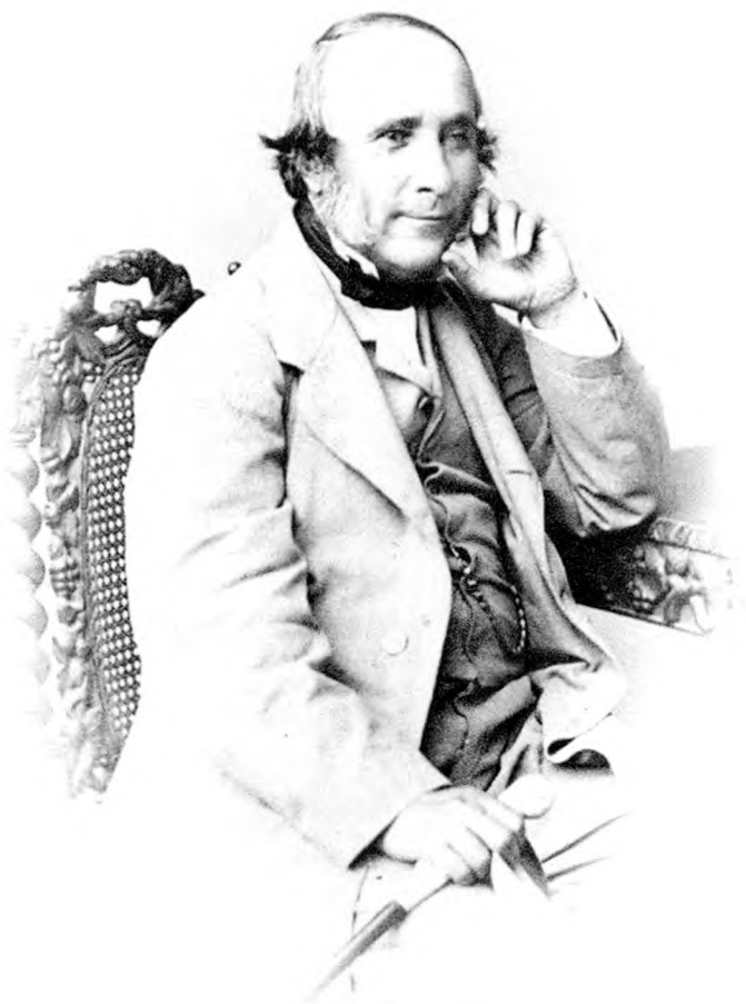
Мікалай Маліноўскі (фотаздымак 1846 года са збораў бібліятэкі Ягелонскага ўніверсітэта, Кракаў, Польшча)