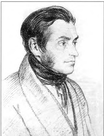
А. Кіпрэнскі. Партрэт Адама Міцкевіча (1824)