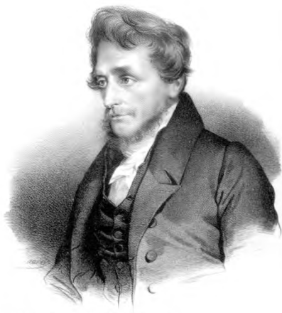
Партрэт І. Лялевеля. Літаграфія Вілена