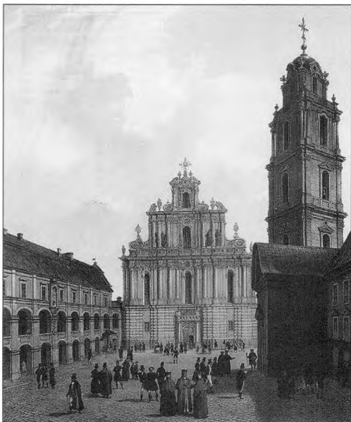
Ф. Бенуа. Вялікі двор Віленскага ўніверсітэта. З «Віленскага альбома» Я. К. Вільчынскага