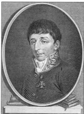
М. Падалінскі. Партрэт прафесара Г. Э. Гродэка