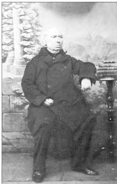
Мікалай Маліноўскі (фотаздымак 1865 года са збораў бібліятэкі Ягелонскага ўніверсітэта, Кракаў, Польшча)

(з працы В. В. Гарбачовай «Паўстанцы 1863 году на фотаздымках»; Arche. 2010. № 12. С. 110)