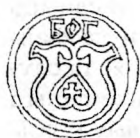
Тып I/a: Герб Багдана Сямёнавіча Скіпарава, зямляніна Га- радзенскага павета, 1543.