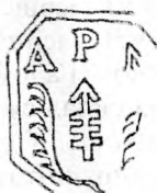
Тып III/a: Герб Адама Паўла Макаро- віча, паборцы зямскага Гарад- зенскага павета, 1674.