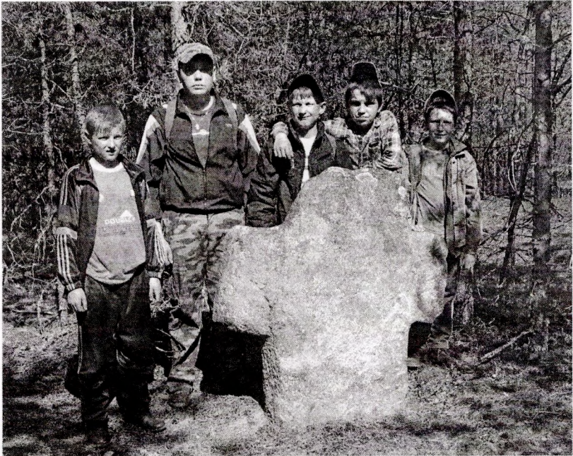
Каменны крыж каля в. Рэўтполле

На Лепельшчыне да нашага часу захаваліся пахавальныя помнікі XIV–XIX стагоддзяў. Яны як і курганы з'яўляюцца неад'емнай часткай матэрыяльнай і духоўнай культуры нашых продкаў. Вывучэнне гэтых помнікаў дазваляе разгледзіць шэраг гістарычных пытанняў, у тым ліку этнічныя і канфесійныя. Многія з магіл XIV–XIX стагоддзяў маюць знешнія прыкметы — камяні або каменныя крыжы.