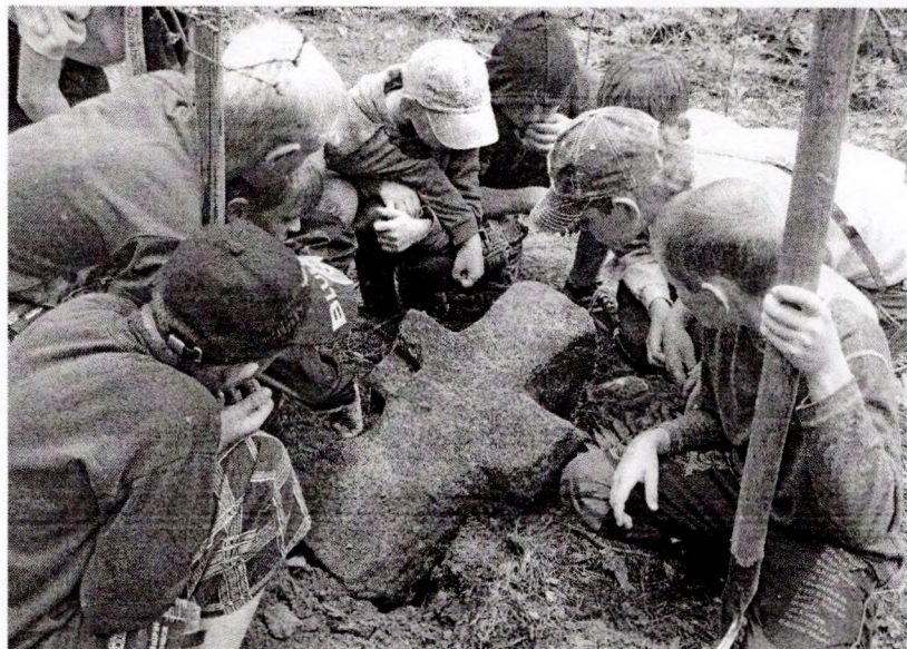
Каменны крыж у в. Рудня