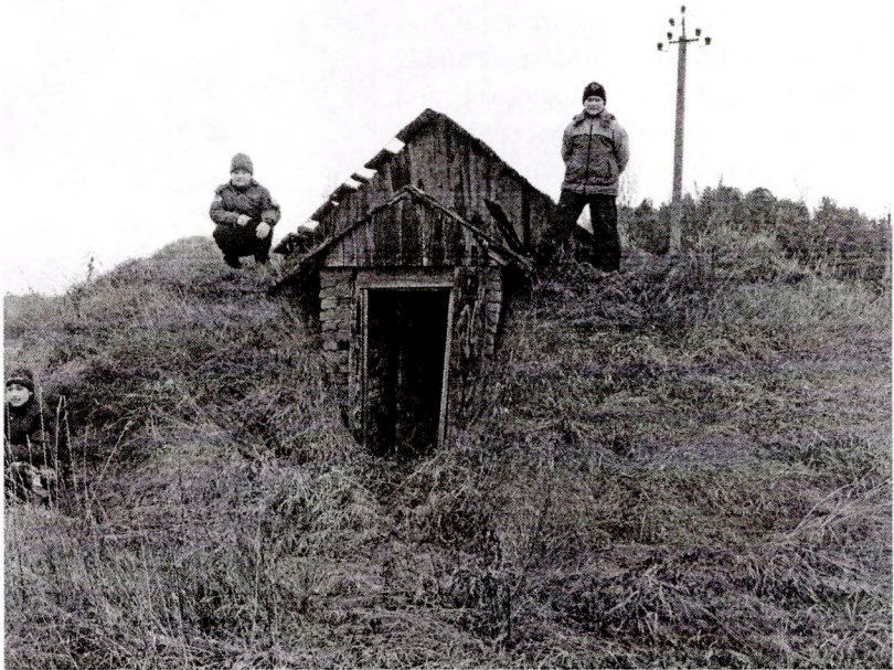
Курганны у в. Свядзіца