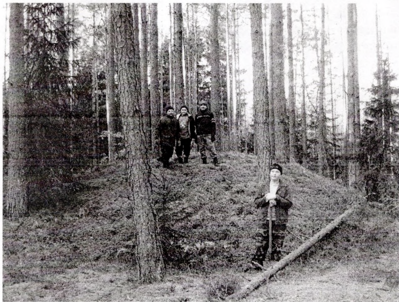
Курганны могільнік каля в. Замошша Чашніцкага раёна

Па словах вяскоўцаў курганоў у тутэйшых мясцінах многа. Распавялі паданне, што насыпы з'явіліся пасля вайны з Напалеонам. На гэтым беразе (левым) ракі Эса пахаваны францу-