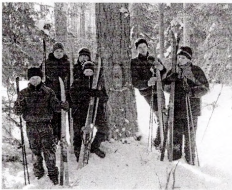
люты 2012 г. «Нашчадкі» ля партызанскай сасны