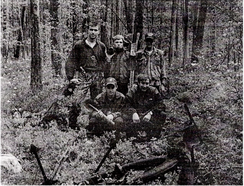
Ля рэштак савецкага самалёта

ляжалі рэшткі самалётаў. На гэты раз без пабочнай дапамогі рашылі знайсці іх, за што і паплаціліся. Некалькі гадзін дарэмна круціліся па балоце. З Верабак накіраваліся ў бок вёскі Юшкі. Мінным летам жыхар вёскі Уладзімір Юшко паказаў захаванне шасці нямецкіх салдат непадалёку ад вёскі. Ужо тады магіла была раскапана. Гэта справа мясцовых падлеткаў, якія з пакалення ў пакаленне шукаюць там нейкія скарбы. Вось і цяпер мы ўбачылі нядаўнія раскопы — вакол ямы валяліся фрагменты чалавечых касцей, кавалкі скураных рамянёў, алюмініевыя гузікі. Склаўшы ў адно месца знаходкі, прысыпалі іх зямлёй. У сляпой нянавісці мы забываем пра маральны бок сваіх вар'яцкіх паводзін. І знявагу да ворага пераносім на сябе. Прага нажывы штурхае капаць і магілу нямецкага салдата, і курган нашага далёкага прашчура. У Юшках сустрака-