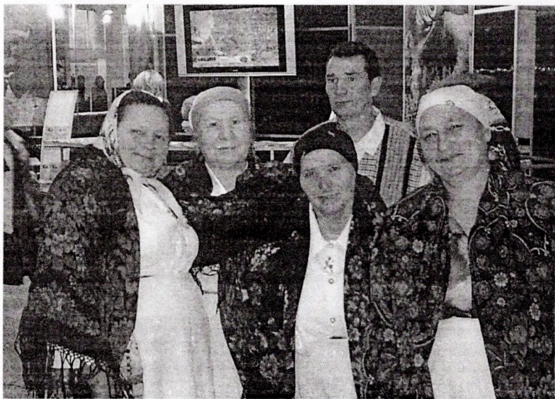
Фальклорны гурт «Аношкі»