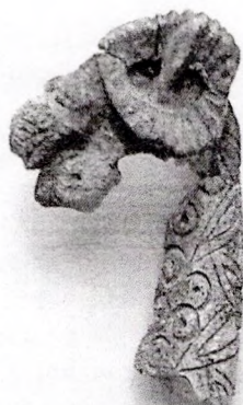
Касцяная ручка «Галава барана»

Усяго за восем дзён археалагічнай экспедыцыі было раскапана і вывучана пяць курганоў, сабраны даволі багаты матэрыял, які патрабуе далейшай навуковай апрацоўкі. Але ўжо цяпер, на падставе знаходак, можна гаварыць, што могільнік належыў крывічам і датуецца X-XI стагоддзямі.