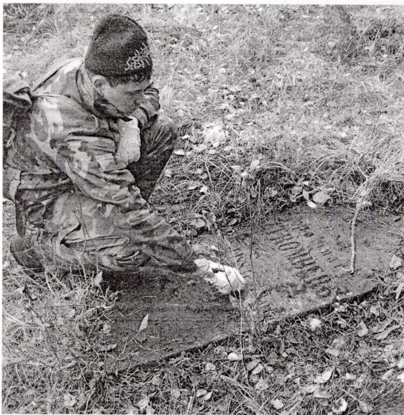
Пахаванне Штрэмбергаў у в. Зацяклясе

Напачатку XIX стагоддзя, калі была збудавана Бярэзінская водная сістэма, навакольныя землі набылі Штрэмбергі.