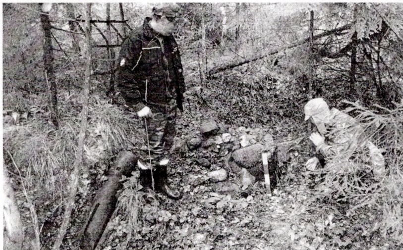
Партызанская лазня. Урочышча Сываратка

Лета — пара масавых адпачынкаў і сезон падарожжаў. Вось і мы адправіліся ў чарговую вандроўку-экспедыцыю, прымеркаваную да дня вызвалення Беларусі ад нямецка-фашысцкіх захопнікаў. Даволі часта даводзілася чуць ад жыхароў вёскі розныя гісторыі, звязаныя з мінулай вайной. У старажылаў яшчэ ў памяці месцы партызанскіх пахаванняў, якіх даволі шмат было раскідана па лесе. Дзесьці ў 1960-70-х гадах магілы былі знесены і ніякіх слядоў не засталася, толькі ўзялі крыху зямлі, каб насыпаць ля помніка ў Слабадзе. Грыбнікі-ягаднікі расказвалі пра партызанскія зямлянкі. А яшчэ, каб прыдаць сваім словам больш увагі, мясцовыя фантазёры паведамлялі пра танк. Нібыта гэтая шматтонная махіна і цяпер знаходзіцца ў адным з балот. Загадзя мушу расчараваць: гісторыя з танкам усяго толькі прыгожы міф, у які так хочацца верыць. Таму вырашылі самі пабачыць, дзе жылі і адкуль адпраўляліся на баявыя заданні народныя мсціўцы.