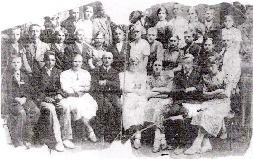
Калектыў Гушчынскай сямігодкі. Фота 1939 г.