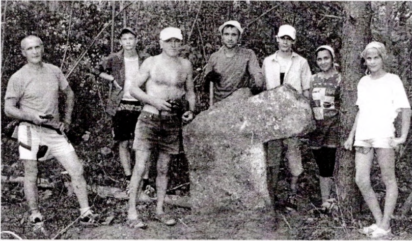
Ля паднятага крыжа ў в. Велеўшчына

знаходзіцца на ўскайку вёскі Велеўшчына. Старыя, парослыя дрэвамі і хмызам, могілкі мяжуюць з сучаснымі пахаваннямі. Сярод паўтара дзясятка каменных надмагілляў па форме можна вылучыць некалькі крыжоў, што, не вытрымаўшы выпрабаванне часам, паваліліся і паціху абрастаюць мохам.