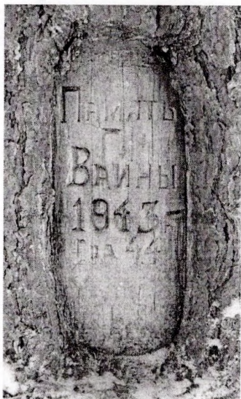
Надпіс на сасне

У гады Вялікай Айчыннай вайны, з 1942 па 1944 гады, улесе за вёскай Стайск базіраваліся розныя партызанскія фарміраванні. Надзейна хаваў пад сваімі шатамі векавы бор народных мсціўцаў. Верагодней за ўсё, ужо пасля вайны нехта з партызан на адной з соснаў пакінуў надпіс «Памяць вайны 1943 — 44 гг.». Менавіта да гэтай, можна сказаць, жывой сведкі вайны, скіраваліся ў чарговы паход. Як толькі адступілі лютыя маразы, юныя краязнаўцы на лыжах рушылі ў дарогу. Пераадолеўшы адлегласць у сем кіламетраў ад Велеўшчыны, слабадскія следапыты дасягнулі сваёй мэты. Што адбывалася амаль семдзесят гадоў таму назад у партызанскім лесе і хто мог пакінуць на дрэве аўтограф, сёння можна толькі здагадацца. Толькі незвычайны помнік, як напамін аб апошняй вайне, яшчэ не адно дзесяцігоддзе будзе вабіць да сябе даследчыкаў тых падзей.