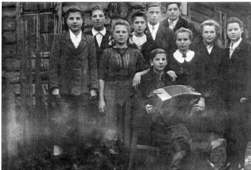
Дзеці вайны. Пасля заканчэння Нябышынскай сямігадовай школы (1951 г.)