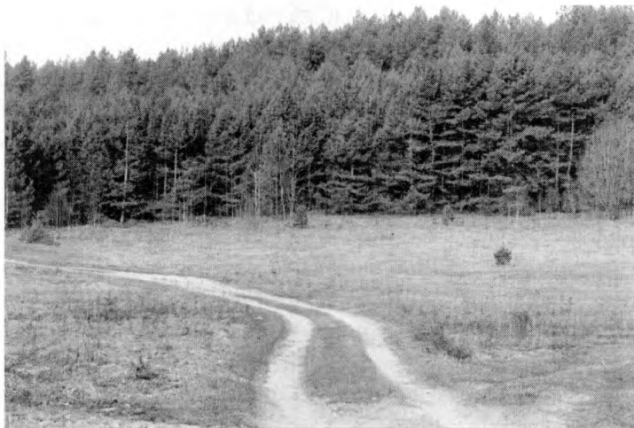
Дарога з Нябышына ў вёску Далёкае. Тут у 1943 годзе партызаны з брыгады Шляхтунова абстралялі немцаў

амаль 9 гадоў, і бегаў я добра. Вуліца вёскі была пустая, я нікога не сустрэў. Але наша хата, пуны і ўсе іншыя пабудовы былі ўжо ахоплены полымем. Такое відовішча назіраць было жахліва. Нават на вуліцы, далёка ад пабудоў было гарача. Гарэлі хаты дзядзькі