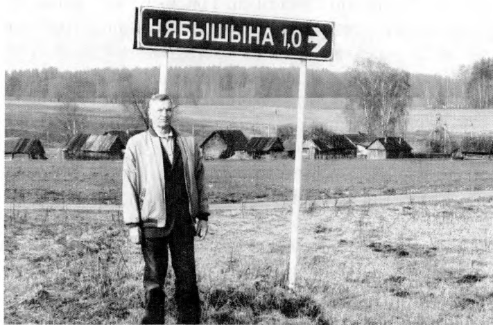
Аўтар кнігі каля роднай вёскі.

Гэта быў першы прыход радзіёнаўцаў у нашу вёску. Усе яны былі апрануты ў новую нямецкую форму, былі добра ўзброеныя: аўтаматы, кулямёты, гарматы, шматствольныя мінамёты, аўтамабілі, палявыя кухні, радыёстанцыі і шмат іншага. Хадзілі чуткі, што на іх галоўнай базе ў Докшыцах ёсць нават танкі, але я іх не бачыў. Нам, дзецям, усё было цікава, і яны, радзіёнаўцы (мы іх называлі яшчэ і народнікамі), давалі нам магчымасць патрымаць у руках зброю. Асабліва падабаліся аўтаматы і пісталеты. Калі гэтыя салдаты хацелі зайсці да каго-небудзь у хату, то пыталіся