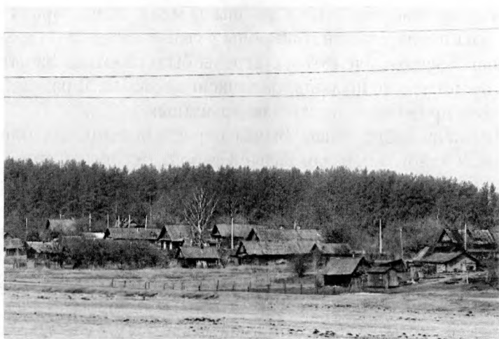
Вёска Нябышына, сучасны выгляд.

Дзеці – удзельнікі партызанскага руху... Я не ведаю, як да гэтага ставіцца, але мушу сказаць, што гэта бесчалавечна. Дзеці павінны быць разам з бацькамі. Не я першы аб гэтым кажу, што