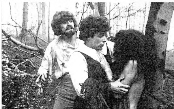
Рис. 7. Кадр из фильма «Дьявол» (1972)

Так трактует конец восемнадцатого века мистический фильм «Дьявол» Анджея Жулавски (1972). Действие происходит в 1792 году, когда в Польшу вступают прусские войска. Прусский шпион с именем Дьявол доводит до безумия польского студента-патриота, которому помогает сбежать из тюрьмы. Черда фантазмагорических сцен, в которых главным мотивом становится раздвоение, зеркальное отражение, иллюзия, нагнетает интонацию ужаса, предчувствия неотвратимого зла, смерти. Низкий тональный ключ, замкнутость декораций, камерность сцен работают на создание образа опустошенной земли, разоренного дома. Действие происходит в брошенных усадьбах, пустынных дворцах, старых монастырях, в голых пейзажах, где нет людей. Безумие, приводящее к гибели, – основной эмоциональный тон фильма.