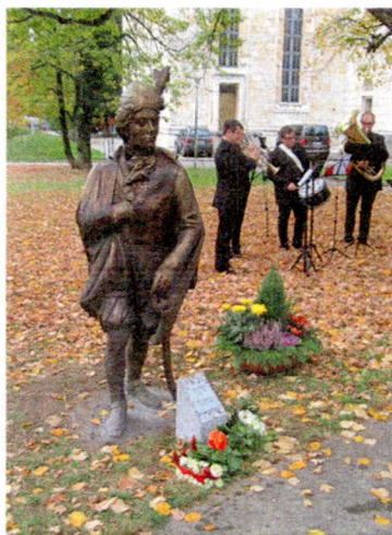
Іл. 4. Помнік Тадэвушу Касцюшку ў Швейцарыі.

Апошнім часам актыўнасць беларусаў па ўшанаванні памяці пра свайго земляка-героя выйшла за межы яго радзімы, сягнуўшы нават Швейцарыі. Там у 2017 г. адкрыўся першы ў свеце помнік Тадэвушу Касцюшку, пастаўлены суайчыннікамі (іл. 4).