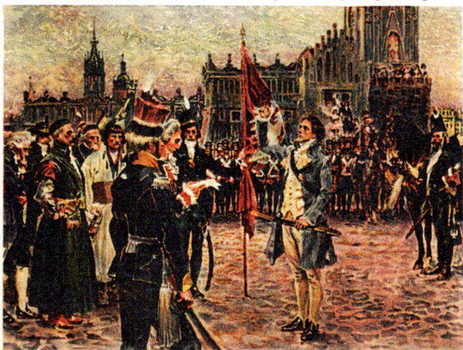
Mal. Wojciech Kossak. Przysięga Tadeusza Kościuszki na rynku Krakowskim 24. marca 1794.

ponadto w swoim dorobku obraz olejny, o wymiarach 71 x 97 cm, Jan Kiliński prowadzący jeńców rosyjskich po ulicach Warszawy (1908) znajdujący się w Muzeum Śląska Opolskiego. 106 Obraz ten również był wielokrotnie reprodukowany na kartach pocztowych [Il. 10].