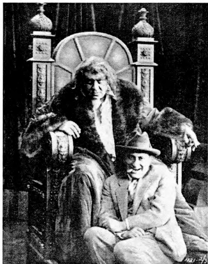
Рис. 3. Эмиль Яннингс в роли Павла Первого в фильме «Патриот» (1929)

В белорусском фильме «Поручик Киж» (1934) Александра Файнциммера по сценарию Юрия Тынянова царствование Павла Первого изображается как время беспросветной глупости и бюрократии, которая даже наделена животворной силой.