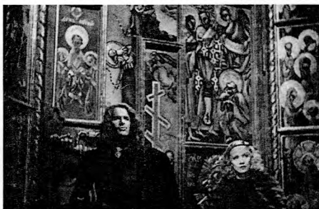
Рис. 5. Кадр из фильма «Распутная императрица» (1934)

Впрочем, материал российской истории зарубежные кинематографисты всех времен используют как основу для экзотичной истории, которая именно экзотичностью и впечатляет. В ход идут всевозможные вампуки и смысловые клише, связанные с рускостью: дремучесть, отсталость, роскошь и щедрость, безумие и импульсивность, распутство, жестокость, словом, средневековье. На этом построены и колоритный образ Павла Первого в картине «Патриот», и образ Екатерины Второй в постановке Джозефа Штернберга «Распутная императрица» (1934) с Марлен Дитрих в главной роли.