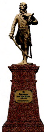
Іл. 5. Помнік Тадэвушу Касцюшку ў Марачоўшчыне. [Электронны рэсурс]. – Рэжым доступу: http://1reg.by/2018/01/23/ivacevicki-rayuyikankam-dazvoliu-pastavic-pomnik-kascyushku-u-kosave/ . – Дата доступу: 13.01.2018.