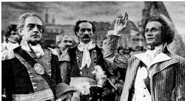
Рис. 2. Кадр из фильма «Костюшко под Рацлавицами» (1938)

в более позднее время, когда кинематограф Польши находился под советским идеологическим влиянием, Костюшка как носитель польской национальной идеи наверняка был под негласным запретом.