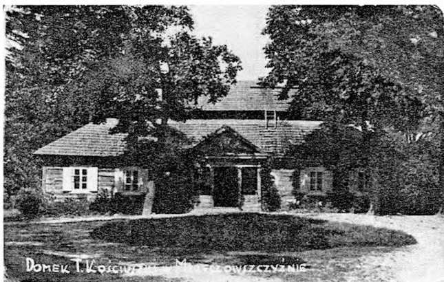
Гл. 3. Адзін з апошніх фотаздымкаў радзіннага дома Касцюшкаў у Марачоўічыне (фотамастак Юзаф Шыманьскі, 1937 г.).

З пачатку XXI ст. савецкая культурная і гістарычная спадчына ў Беларусі паступова страчвае значэнне. Разам з тым большая ўвага звяртаецца ў мінулае менавіта беларускага народа. У т. л. да тэмы паўстання 1794 г. і яго лідара. Працэс Касцюшкавай мемарыялізацыі на Беларусі з часам інтэнсіфікуецца. Павялічваецца колькасць вуліц з імем сусветна вядомага земляка, помнікаў яму, памятных знакаў, музейных экспазіцый.