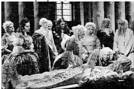
Рис. 6. Кадр из фильма «Распутная императрица» (1934)

Образ Екатерины Второй контрапунктом развивается от наивной образованной девушки с идеалистическим взглядом на мир к жестокой императрице, потакающей своим прихотям.