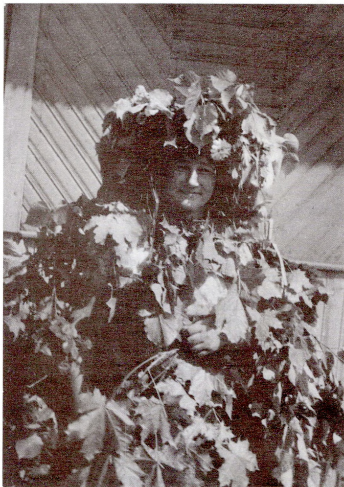
Куст з Піншчыны

Той сабе красную панну азьме. Наш Сымонка сачавічаньку парве, Ён сабе красную панну азьме.