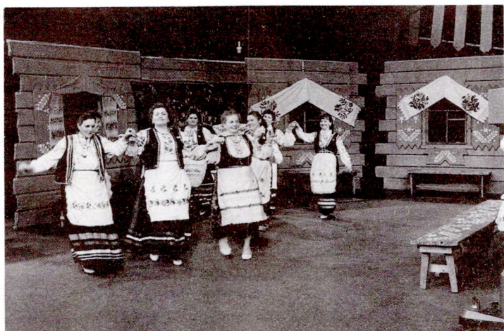
Юраўскі карагод з в. Валаўск Ельскага р-на

на?" Той адказвае: "Горка!" — "Дай Бог, каб і наша скацінка для звяроў была горка!"