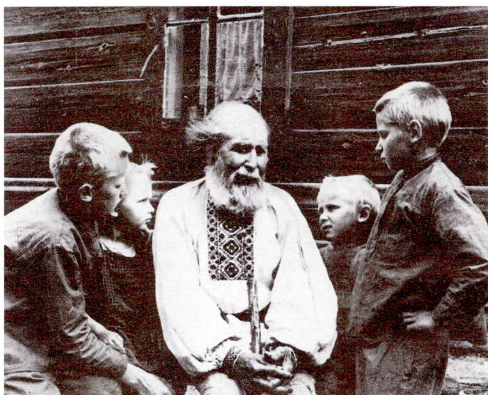
Ад дзядоў — толькі добрае

прырода разважна, так і памяць нашая не згасе, асвятляе шляхі наступнікам. Верым, як некалі верылі вы, дзяды нашыя: чалавек не знікае без следу. Душа ягоная жыве ў нас, у Сусвеце. Гэта тыя, хто адышоў са сцэжак зямных, перадае нам розум, дух, традыцыі і вопыт. Гэта ад вас шляхі нашыя да дзяцей, унукаў і далей ідуць.