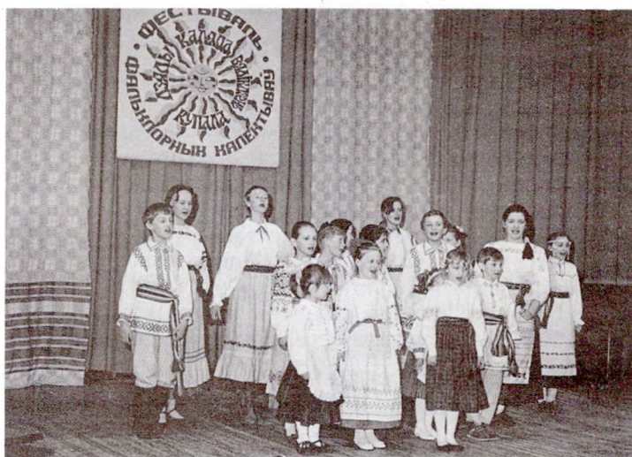
Дзіцячая група фальклорнага гурта «Неруш»

хлопцамі — на Пятра. Вось чаму духаўскія песні так набліжаюцца да пятроўскіх. Кумаванне ўжо страціла свой абрадавы характар, толькі ў некаторых вёсках працягваюць яшчэ хадзіць у лес і там зываць вячком дзве галінкі бярозы або галінкі дзвюх суседніх бяроз. Варажба заключаецца ў наступным: звянуць гэтыя дзве галінкі ці застануцца свежымі, калі праз тыдзень прыйдуць іх развіваць. Загадваюць найбольш: ці буду я жывая, шчаслівая, здаровая, ці выйду замуж і да т. п. Звычайна кумленне ўяўляе сабой гульні, прычым дзяўчаты гуляюць там, дзе завівалі вянкi, а з хлопцамі — у той хаце, дзе зімой былі вятorki. У лесе рабілі вогнішча, ладзілі арэлі, вадзілі карагоды, наладжвалі танцы, гульні, скокі. Калі прыходзілі хлопцы, у іх зрывалі шапкі і кідалі ў вогнішча, дзяўчаты барукаліся з імі.