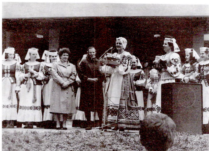
Валачобнікі з г. п. Свіслач

Валачыліся, намачыліся. Зайшлі да бабкі — пасушыліся. І дала бабка ўсім па ячку. Адной сіраціне не дасталося. Дала ж бабка курку рабую. Сірата не бярэ і з двара не ідзе. І дала бабка дзеўку красную. Сірата ўзяла і з двара пайшла. І падскакваючы, і падзякваючы: — Ай, дзякуй, бабка, за красную дзеўку!