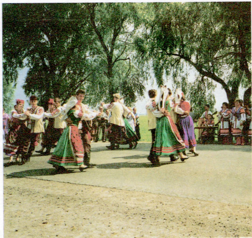
Тураўски карagod. На Юр'е