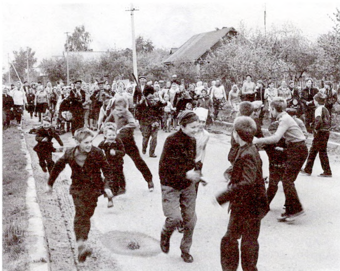
«Як пушчу стралу ўздоўж па Неглюбцы» (Веткаўскі р-н)

Маці старая, сястра малая, Ох і вой люлі, сястра мала... у-у-у! Жана малада каля горада, Ох і вой люлі, каля гора... у-у-у! Дзеткі дробныя, невыгодныя, Ох і вой люлі, невыгодны... у-у-у!