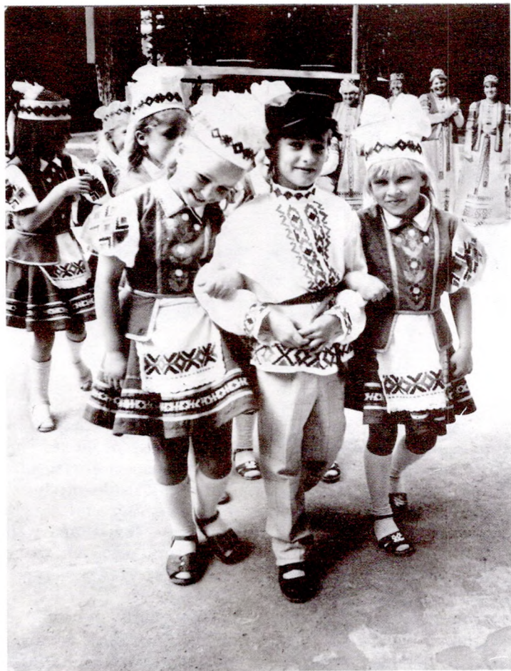
Танец-тройка «Як я быў малы»

Радзей таго наша гаспадынька, Што жыта даждала.