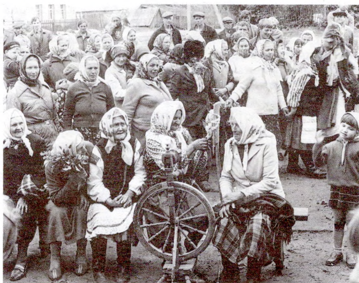
«Не дрём, дрёма, пад кудзеляй» — карагод Стралы

Ой, люлі-люлі, хорошы, прыгожы, Пашый мне спаднічку з чырвонае ружы, Ой, люлі-люлі, з чырвонае ружы. — Дзевачка красная, душа, маё сэрца, Ой, люлі-люлі, душа, маё сэрца, Напрадзі мне нітачак з жоўтага пясочку, Ой, люлі-люлі, з жоўтага пясочку. Што б ніткі не рваліся, спаднічка не рвалася, Ой, люлі-люлі, спаднічка не рвалася. — Моладзец, моладзец, хорошы, прыгожы, Ой, люлі-люлі, хорошы, прыгожы. Купі мне пярсцёнак, як жаркае сонца, Ой, люлі-люлі, як жаркае сонца. — Дзевачка красная, душа, маё сэрца, Ой, люлі-люлі, душа, маё сэрца. Напой майго коніка сярод сіня мора, Ой, люлі-люлі, сярод сіня мора. Што б конік напіўся, капыт не ўмачыўся, Ой, люлі-люлі, капыт не ўмачыўся.