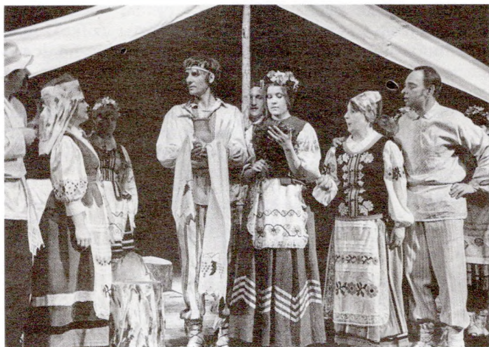
«Купальская поч» у фальклорным тэатры «Жалейка» з Гомеля

да дзяўчыны, тая кідала яго назад у адказ на гэта сімвалічнае запрашэнне разам пераскочыць праз агонь. Калі вянок пападзе да хлопца, ён павінен яго разарваць або кінуць назад.