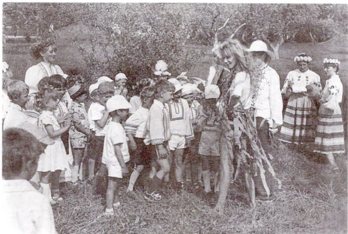
Зборы на Купалле

Лічылася, што ў гэты час каляндарная вяршыня росквіту прыроды, бо ўжо хутка "прыдзе Пятрок — ападзе лісток". Яна вызывала і самую актыўную дзейнасць варожых чалавеку прыродных сіл: ведзьмаў, чараўнікоў, гадаў, сурокаў. Дзяды і спрыяльныя сілы прыроды, часцей за ўсё ў выглядзе "купальскіх зёлак", дапамагалі людзям пазбегнуць злой сілы: