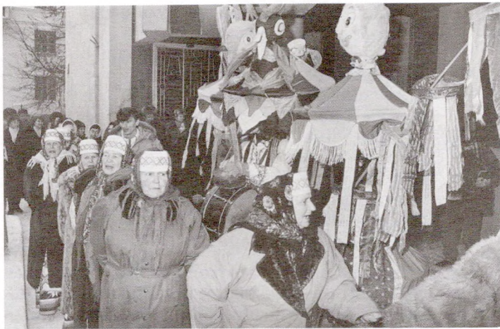
Стрэчаньскі карагод з вёскі Прусіна Касцюковіцкага р-на

— Добрае здароўе, лецечка з кіенькамі! Пайшла зімачка з кастылькамі, Прыйшло лецечка з кіенькамі.