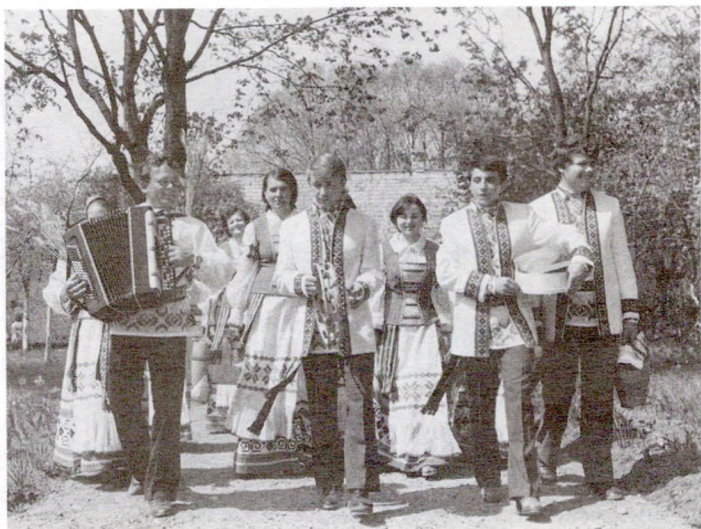
Валачобныя — госці рэдкія

ковыя вытокі якога — у велікодным звычайі. Вось прыклады найбольш цікавых з іх: