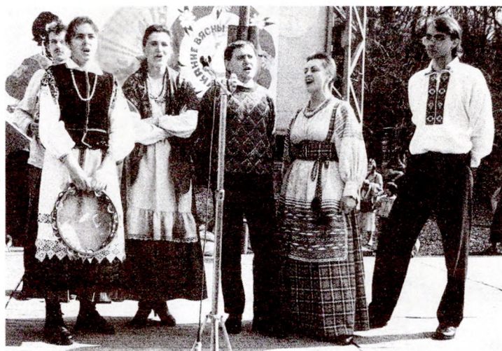
«Дзянніца» гукае вясну

А Ганусячку ў святліча... у-у-у! У святлічаньку, Даў коніку сена й аў... у-у-у! Сена й аўса, А Ганусячцы піва і ві... у-у-у! Піва і віна, Цяпер жа ты навек мая... у-у-у!