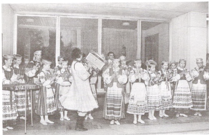
Узорны дзіцячы фальклорны калектыў «Дударыкі»