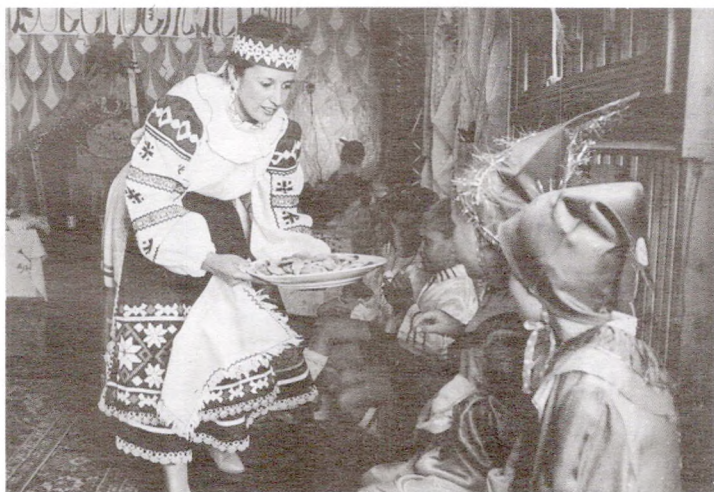
Пакроўскія ласункі ў дзіцячым садку