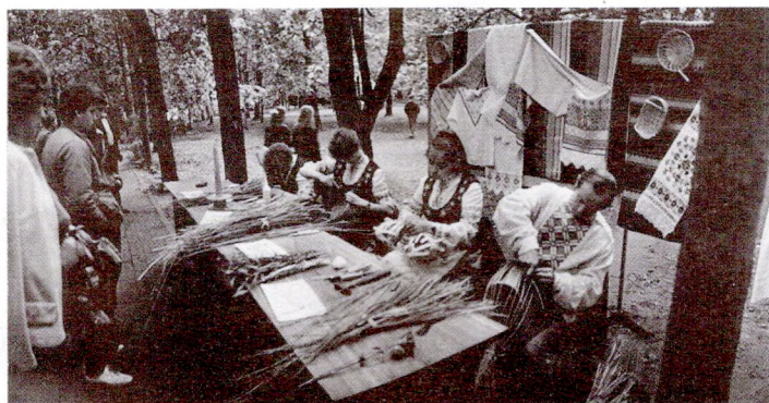
Рыхтуюцца да свята пастушкоў

Разгуляўся Юр'еў конь, Разбіў камень капытом. Як у камне зерне ёсць, Так у хлопцаў праўда ёсць. Разгуляўся Юр'еў конь, Разбіў гарэх капытом. Як у гарэху зерне ёсць, Так у дзяўчынак праўда ёсць. Загарэўся шчыры бор: — Вы бяжыце, хлопцы, тушыці, Рэшатам ваду насіці. А ў рэшаце вады нет, У нашых хлопцаў праўды нет. Загарэўся шчыры бор: — Вы бяжыце, дзевачкі, тушыці, Вядзёркам ваду насіці. А ў тым вядры вады ёсць, У нашых дзевак праўда ёсць.