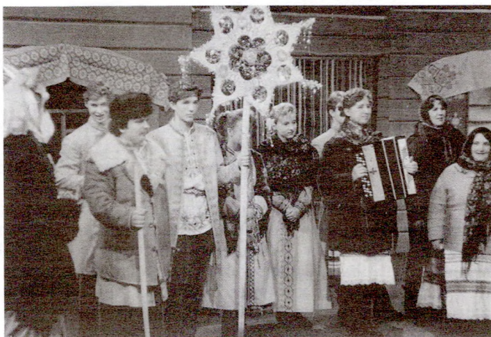
Каляднікі з зоркай з в. Анапаль Мінскага р-на

няццем хрысціянства набыла яшчэ біблейскія рысы віфліемскай зоркі, якая асвятіла месца чудоўнага нараджэння Хрыста. У гэты час часцей за ўсё спявалі хрысціянізаваныя калядкі: