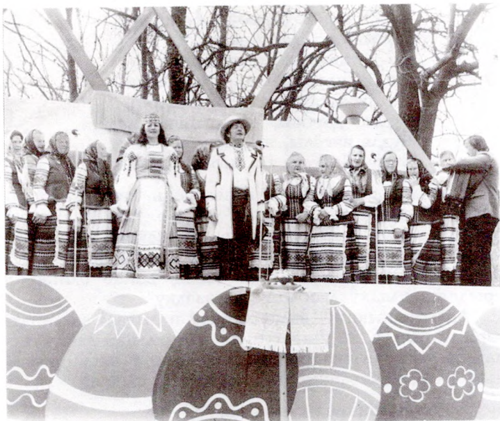
Вялікдзень на радзіме Кастуся Каліноўскага

300 радкоў, песень, у якіх ахоплены ўсё гадавое кола клопатаў земляроба: