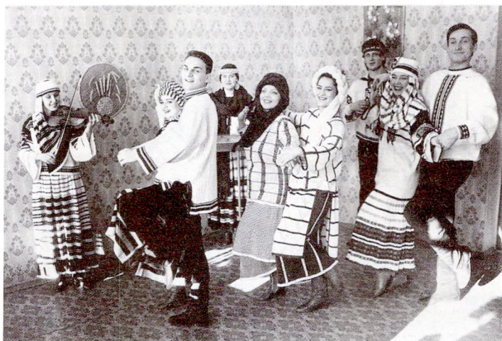
Фальклорны гурт «Кірмаш»

збірацца на вячоркі, хатняя праца спалучалася з песнямі, танцамі, гульнямі, выбіралі будучых жонак. Тут расказваліся казкі, быліны, паданні, легенды, загадваліся загадкі.