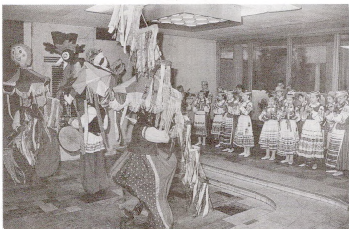
Стрэчанне ў Доме літаратара

А ў вакенячку кватэра... У-у-у! Кватэрачка, Ох, кіну-гляну ў вакеня... У-у-у! У вакенячка, Да й на вуліцы пылок мя... У-у-у! Пылок мяце, Божая маці танок вя... У-у-у! Танок вядзе, Шчэ й з маладымі дзяўчата... У-у-у! З маладымі дзяўчатамі, А шчэ й з намі сяброўка... У-у-у! Сяброўкамі.