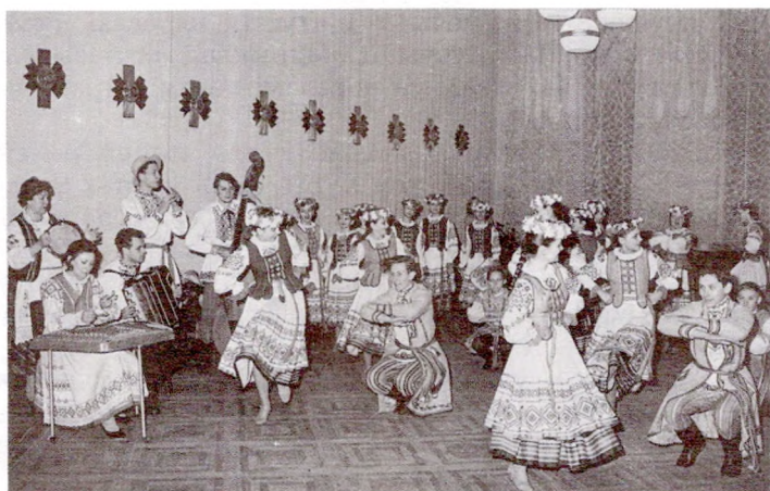
Фальклорны калектыў «Жавароначкі» з Мінска

Упаў камень да й ляжыць, На чужыне гора жыць.