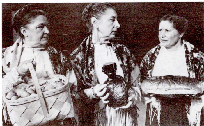
Па шляху да дзядоў

вельмі ёмістым і глыбокім паняцці "Дзяды". У іх беларусы бачылі свае жыццёвыя карані, моц традыцыі, значыць, і народа, аснову выхавання новага пакалення праз адбор лепшага ад мінулага, павагі да бацькі-маці, дзеда-бабулі, настаўніка, старэйшага чалавека.